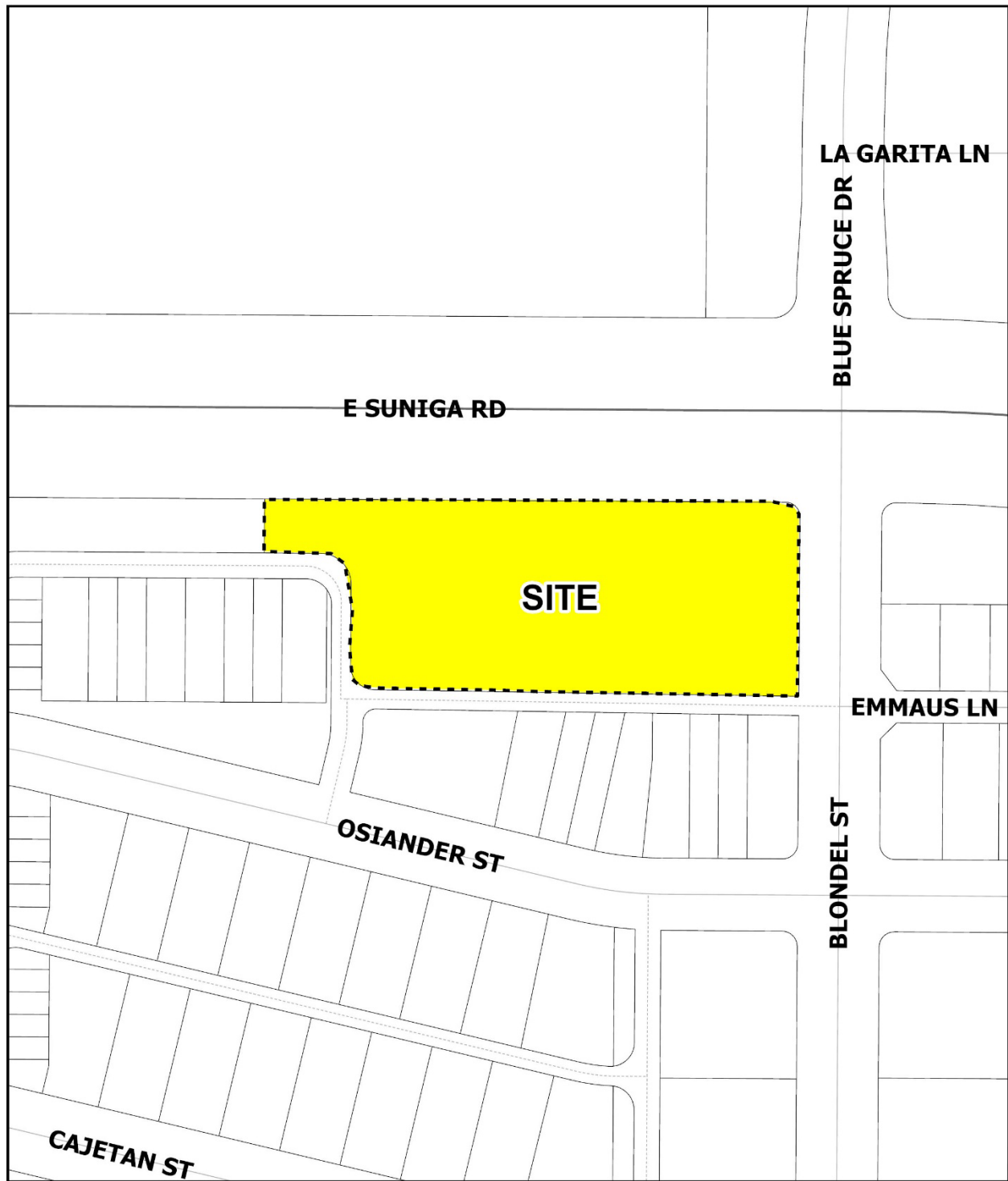
The Ellie at Old Town North- CDR230099 VICINITY MAP